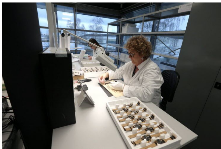
La partie du nouvel atelier réservée au contrôle des montres.